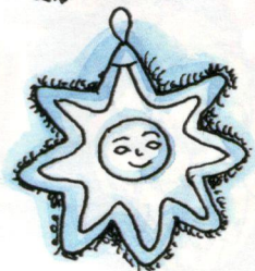
Рис. Ирины Шумилкиной