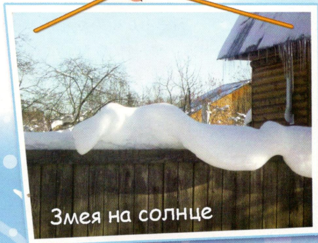
Змея на солнце