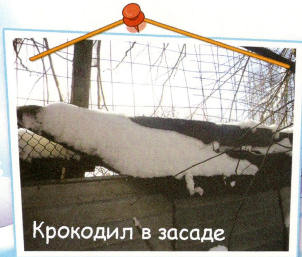
Крокодил в засаде

Пока мы работали, выглянуло солнышко, и снег начал подтаивать. Я оглянулся — и глазам своим не поверил! Вокруг были такие снежные картины и скульптуры, каких я ни в одном музее не видел! Повсюду на заборах притаились снежные крокодилы, слоны, птицы... Интересно, почему я их раньше не замечал?